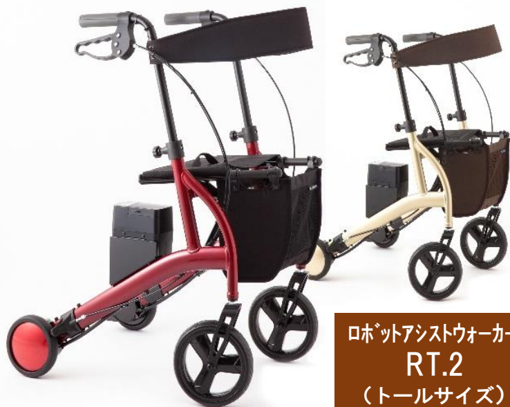
ロボットアシストウォーカー RT.2 (トールサイズ)

場所：西播磨総合リハビリテーションセンター 研修交流センター 福祉用具展示ホール