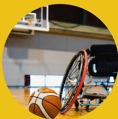
車椅子バスケットボール