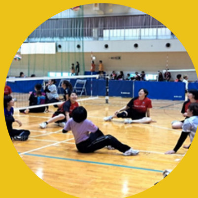
シッティングバレーボール