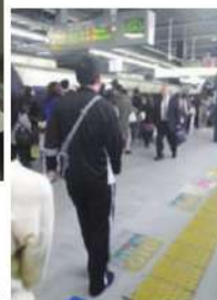
復職に向けた 通勤練習▶