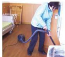
▲単身生活シミュレーション

病気や事故の後遺症として高次脳機能障害（注意障害・記憶障害・遂行機能障害・失語症等）を有する利用者、集団プログラムを実施しています。また、家族との協働により効果的な対応方法を検討し、その成果を施設や地域での生活につなげていきます。