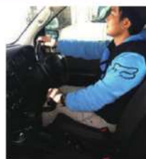
▲改造教習車での運転訓練

障害のある方の自動車運転操作能力を評価する「試乗適性評価」、自動車運転の「習熟訓練」を行い、外出や通勤の移動手段としての実用性を見極めます。自動車学校の現役教官による指導が受けられ、脊髄損傷、左・右片麻痺など障害特性に合わせた改造車を使用でき、自家用車の選定や改造に関するアドバイスも実施しています。