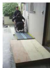
◀住宅訪問による 改修案の提案

復学、復職、就労、単身生活など、利用者個々の目標は異なります。それぞれの状況に合わせたプランを立て、よりスムーズな社会復帰につながるよう支援しています。