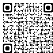
マイナビ先輩情報