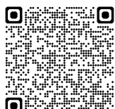
先輩情報・仕事紹介