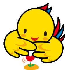
兵庫県マスコット はばタン