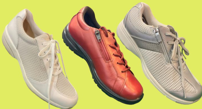
▲しっかりおしゃれで履きやすい、アサヒシューズのメディカルウォークシリーズ