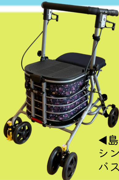
◀島製作所のシンフォニーバスケットSP