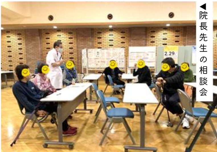
◀院長先生の相談会