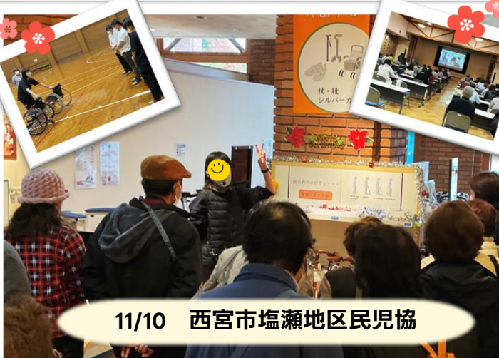
11/10 西宮市塩瀬地区民児協