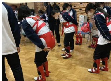
11/21 はくほう会 医療専門学校