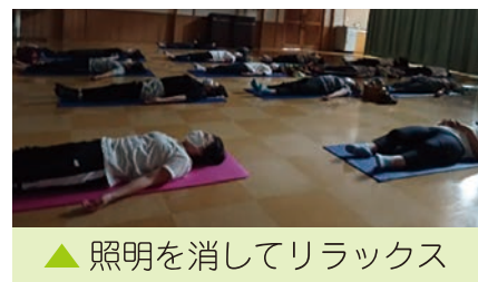
▲ 照明を消してリラックス