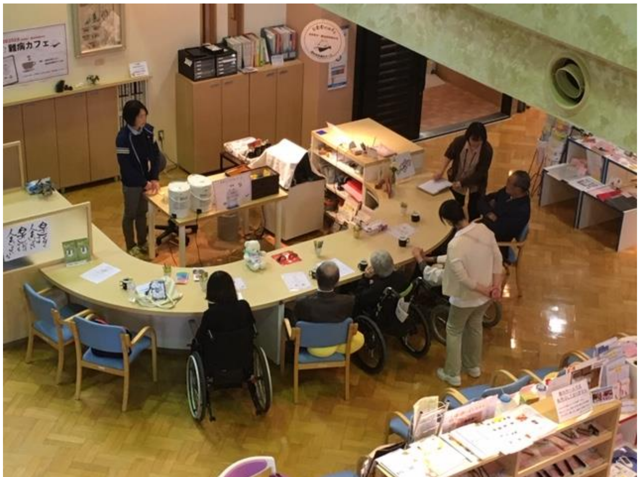
難病カフェの様子