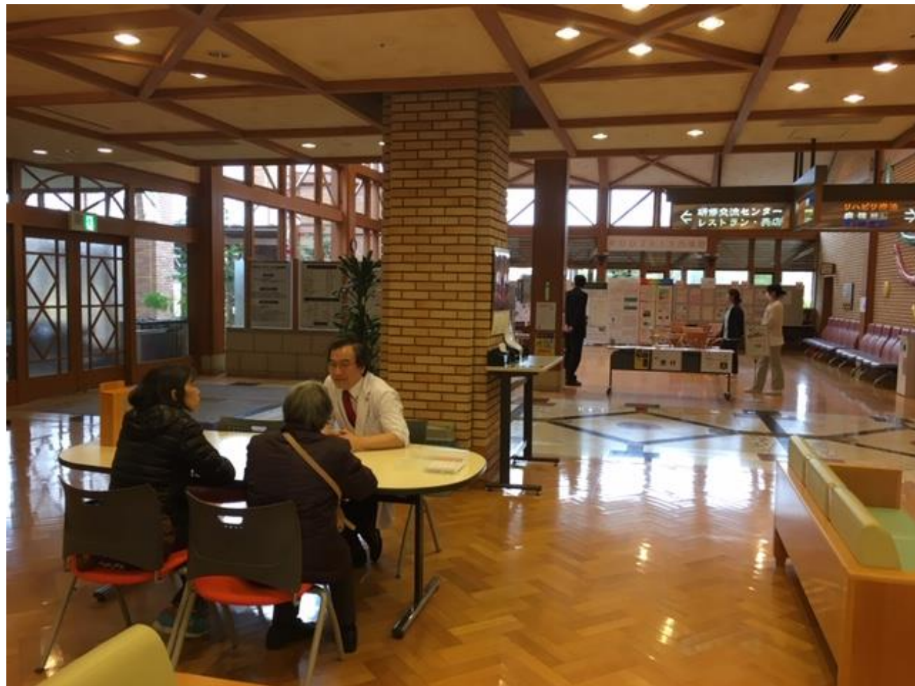
相談コーナーの様子