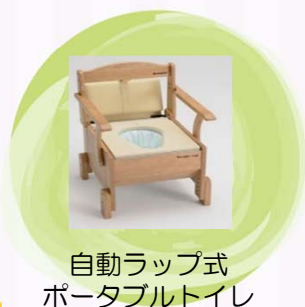
自動ラップ式 ポータブルトイレ