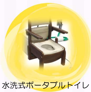
水洗式ポータブルトイレ