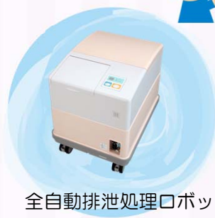
全自動排泄処理ロボット