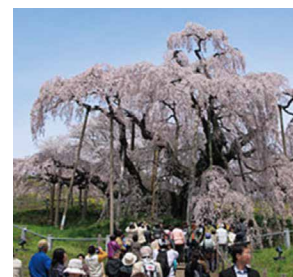
福島県三春町「三春滝桜」

さくら、桜、サクラ、櫻、sakura。自分好みの桜を見つけに、野山に里山に出かけてみませんか。